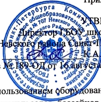
График регулярного обеззараживания воздуха с использованием оборудования по обеззараживанию воздуха в раздевалках спортивных залов, бассейнов, хореографического зала