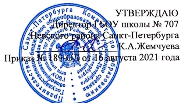
График проветривания школьных помещений