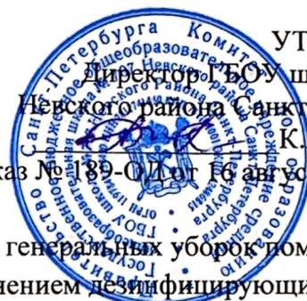
График проведения ежедневных влажных уборок и генеральных уборок помещений с обработкой всех контактных поверхностей с применением дезинфицирующих средств, применяемых для обеззараживания объектов при вирусных инфекциях